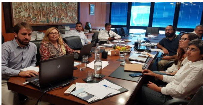
Immagine 4 - I membri del consorzio durante l'ultima riunione.// Figure 4- Members of the consortium during last meeting