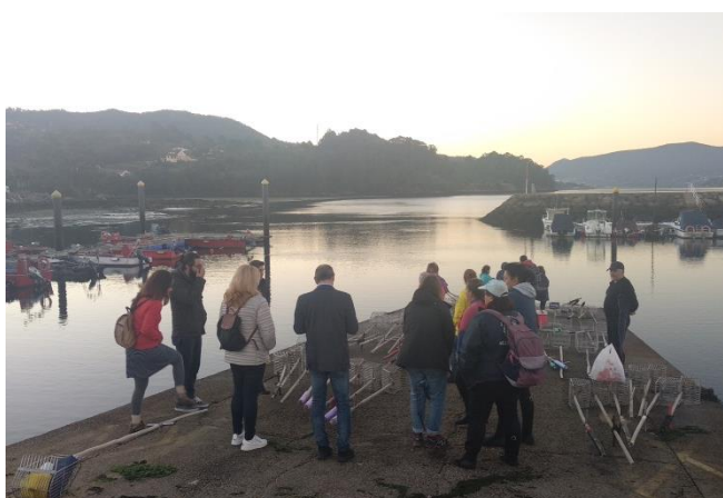
Immagine 3 - I partner visitano i raccoglitori di molluschi in un Ría di Vigo. // Figure 3- Partners visiting the shellfishers in Ría de Vigo

During September and October, the partners have organized 4 events to present the project results. More than 200 attendees had the opportunity to get to know in first hand the outcomes of this project. The first event took place the 26th September in Rize (Turkey), followed by other events the 2nd, 12th and 24th October in Lisbon (Portugal), Cattolica (Italy) and Vigo (Spain) respectively.