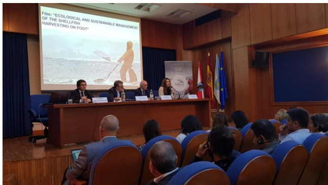
Immagine 2- Presentazione del progetto a Vigo. // Figure 2- presentation of the project in Vigo

promozione del progetto. In tutto sono stati organizzati 4 eventi ai quali hanno partecipato di più di 200 persone che hanno avuto la possibilità di vedere per la prima volta i risultati del progetto. Il primo evento è stato organizzato il 26 settembre a Rize (Turchia), seguito poi dagli altri 3 eventi il 2, 12 e 24 di ottobre rispettivamente a Lisbona (Portogallo), Goro (Italia) e Vigo (Spagna).