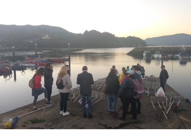
Şekil 3- Proje ortakları Ría de Vigo'da kabuklu deniz ürünleri avcılarını ziyaret ederken.// Figure 3- Partners visiting the shellfishers in Ria de Vigo

During September and October, the partners have organized 4 events to present the project results. More than 200 attendees had the opportunity to get to know in first hand the outcomes of this project. The first event took place the 26th September in Rize (Turkey), followed by other events the 2nd, 12th and 24th October in Lisbon (Portugal), Cattolica (Italy) and Vigo (Spain) respectively.