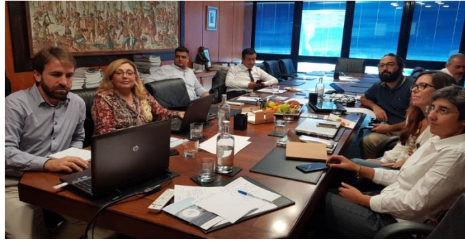
Şekil 4- Son toplantı sırasında konsorsiyum üyeleri Figure 4- Members of the consortium during last meeting

31 Ekimde, proje resmen sona erdi. Ancak, proje ortakları sonuçları yaymak ve topluma sunabilmek için önümüzdeki aylarda çalışmaya devam edecekler. Bu proje 4 ülkeden ortakların birbirlerinden öğrendikleri ve kabuklu su ürünleri avcılığı faaliyetleri için ortak kurallar belirlediği 2 yıllık heyecan verici bir çalışmadır. Konsorsiyum üyeleri, bu eğitim programını geliştirme fırsatı verdiği için Portekiz Erasmus + Ulusal Ajansı'na minnettardır. Bu çalışmanın, kabuklu su ürünleri avcılığı sektöründeki sürdürülebilirliği geliştirmeye yardımcı olacağını umuyoruz.