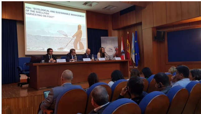
Şekil 2- Projenin Vigo'da tanıtımı.// Figure 2- presentation of the project in Vigo

The consortium has published the training program they have been working on. It is available in the project website: http://www.ecofilmshellfishing.lpn.pt/ in the section "Toolbox". It is composed by 5 videos available in English, Spanish, Italian, portuguese and Turkish.